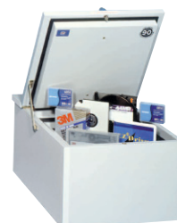
Coffret de protection des données FSDPI08