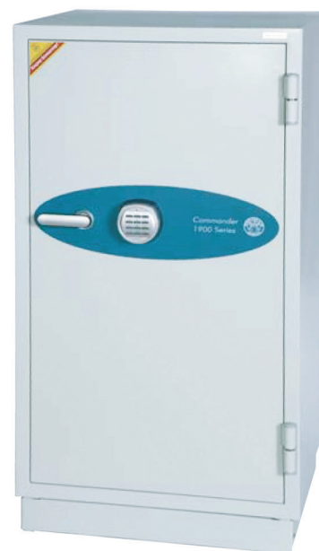
Fire Commander FS1901E

Illustré avec le coffre encastré facultatif pour la protection des données (FSDPI03)