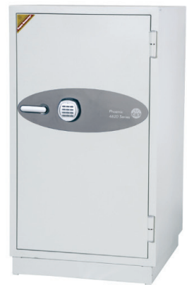
Data Commander DS4621E