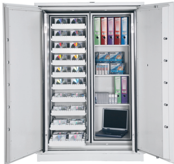
Data Commander DS4623E