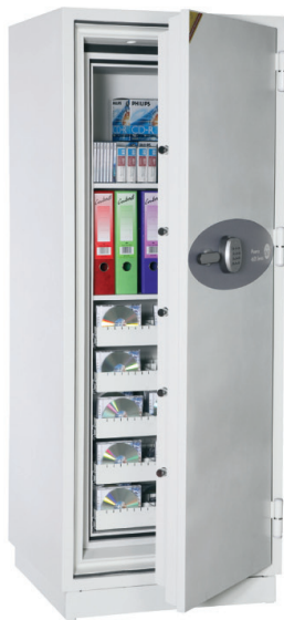
Data Commander DS4622E