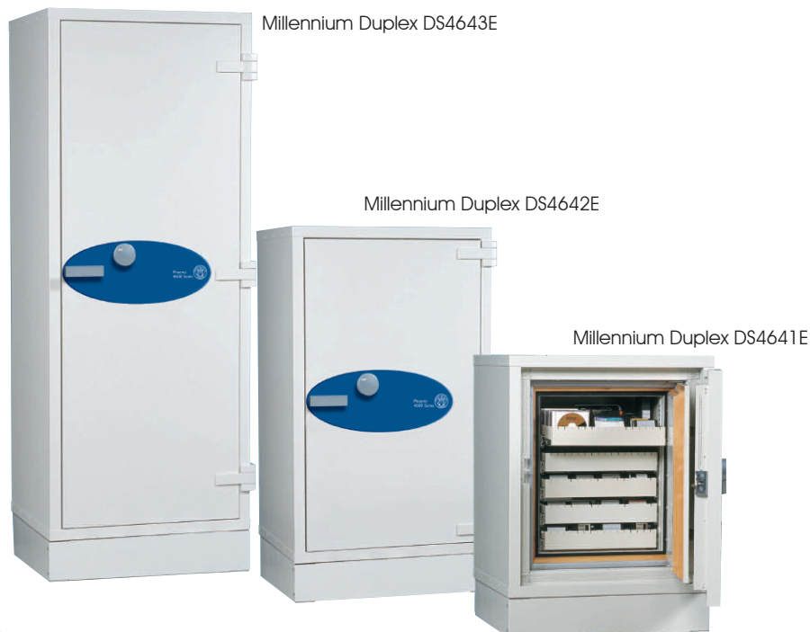
Millennium Duplex DS4643E