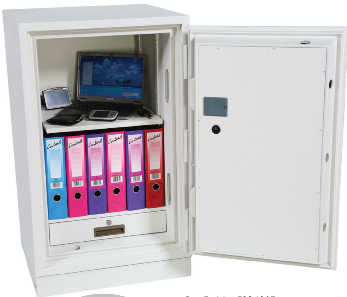
Fire Fighter FS0433E