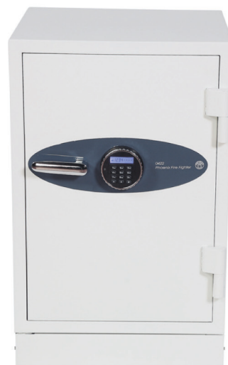
Fire Fighter FS0432E