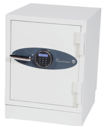
Fire Fighter FS0431E