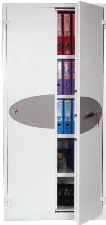
Fire Ranger FS1513K