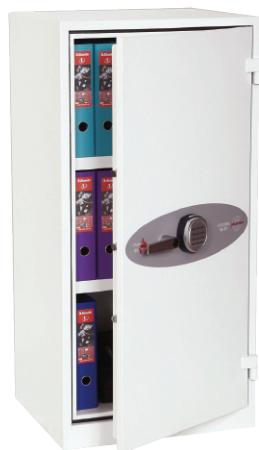
Fire Ranger FS1511E