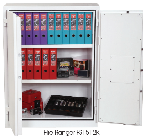
Fire Ranger FS1512K